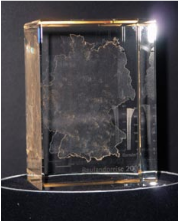
Glasblock mit der Oberfläche der Baulandpreise in Deutschland

reich des Glaskörpers darüber für den Laserstrahl transparent bleibt.