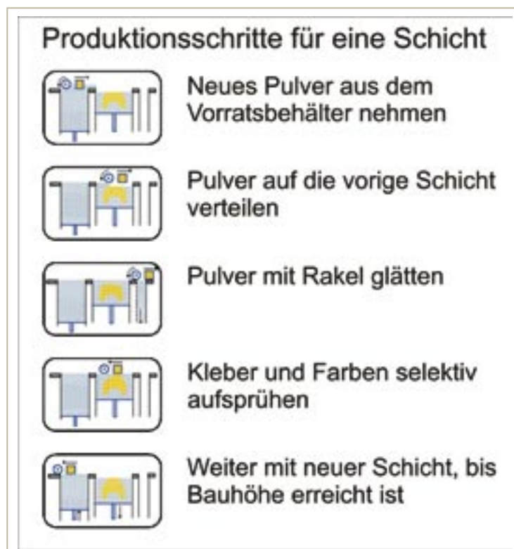
Schritte für den Druck eine Schicht auf dem Drucker Z510.

Seit kurzem ist ein technisches Verfahren verfügbar, das ein dreidimensionales monochromes Bild im Inneren eines Glasblocks festhält. Die 3D-Zeichnungen im Glasblock werden mit einem computergesteuerten Gerät hergestellt. Ein in drei Achsenrichtungen geführter und fokussierter Laserstrahl schmilzt einen eng begrenzten Bereich im Glaskörper. An diesen Stellen wird das Glas undurchsichtig. Die Schmelzpunkte werden von unten nach oben in Schichten angelegt, damit der Be-